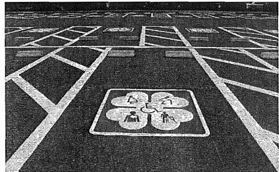
[障害者用駐車枠の状況]