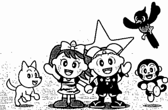
岡山県マスコット「ももっち」「うらっち」