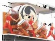
霧島九面太鼓 和奏(わかな)