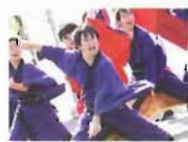
よさこいソーラン 有閑踊り子一座「飛舞人」