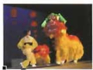
中国スーパー雑技団 中国スーパー雑技団