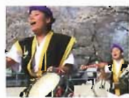
沖縄民族芸能イサー 沖縄エイサー協会