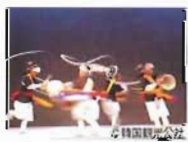
風物ノリ(農楽) 大塚朝太郎音楽文化財団 秀寿(ケムサダン) / 日本支部マシナム