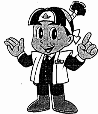
岡山県警マスコット 『ももくん』