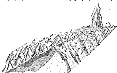
←巨大オブジェイメージ図 縦6m×横9m×高4m程度 制作者 岡部玄（岡山県出身） 至学大学准教授